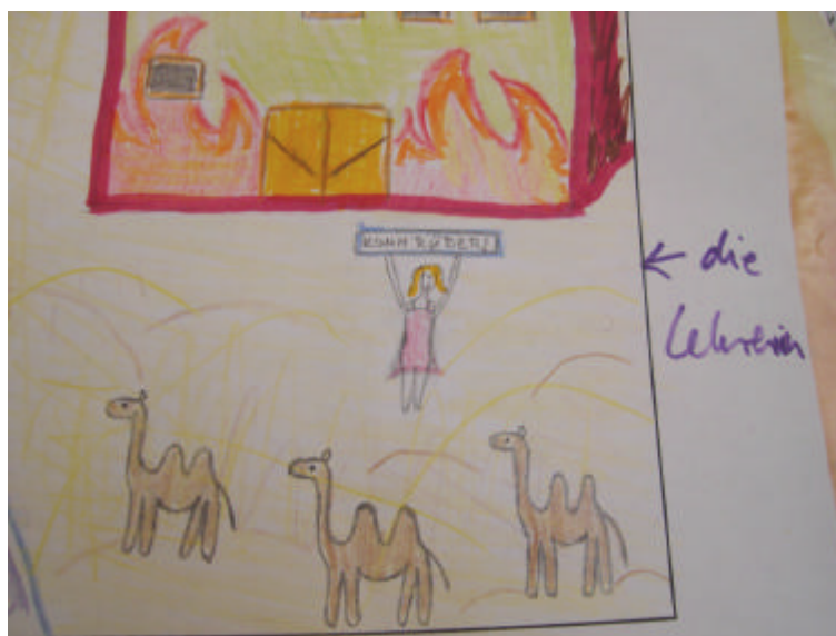
Ausschnitt aus einem Traumbild aus der Freud Schule am ÖI Budapest: Eine Lehrerin als Retterin in der Wüste