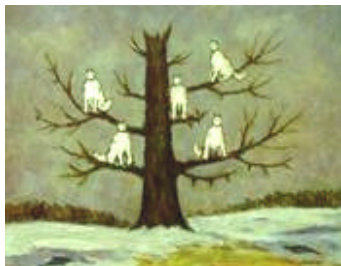
Sergej Pankejeff, Mein Traum , 1964

Ein Tagtraum: Hier inspirierte vorliegendes Bild zu einem lyrischen Text.