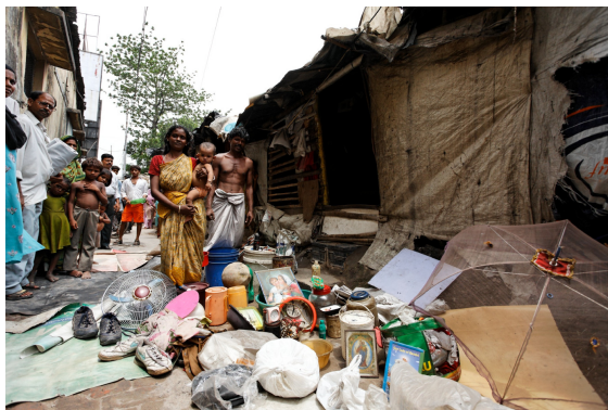
Familie in Indien