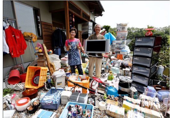
Familie in Japan