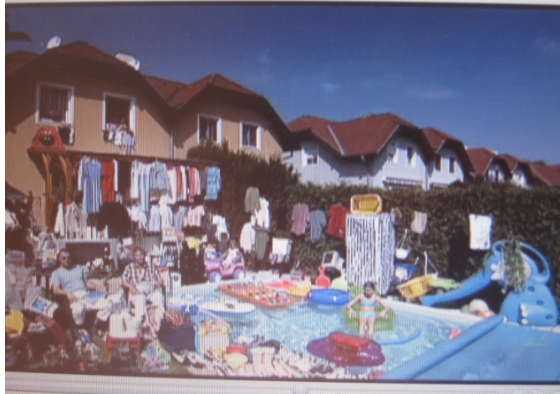
Familie in Österreich